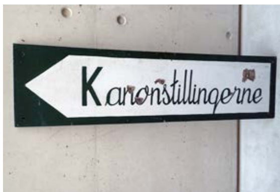
Vejviserskilt fra udstillingen i forbindelse med havnefesten i 1977. I mange år lå skiltet gemt hen i en tidligere tysk garage, men i 2017 kom det »hjem« igen. Bunkermuseum Hanstholm.