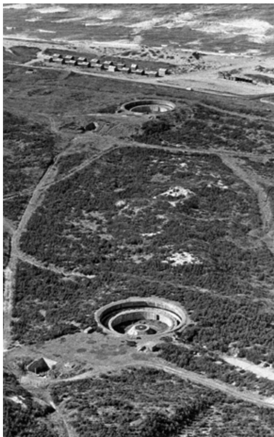
De to vestligste af de fire kanonstillinger til 38 cm-kanoner. Bunkeren i forgrunden er den nuværende museumsbunker. Tage Jensen, 9.7.1976, Bunkermuseum Hanstholm.

museum i fæstningsanlægget. Ifølge Holm manglede man fortsat finansiering til projektet og arealerne var endnu ikke frigivet til museumsdrift. Planerne om et museum i fæstningen skulle ellers ifølge Holm have været igangsat i foråret 1968. 17