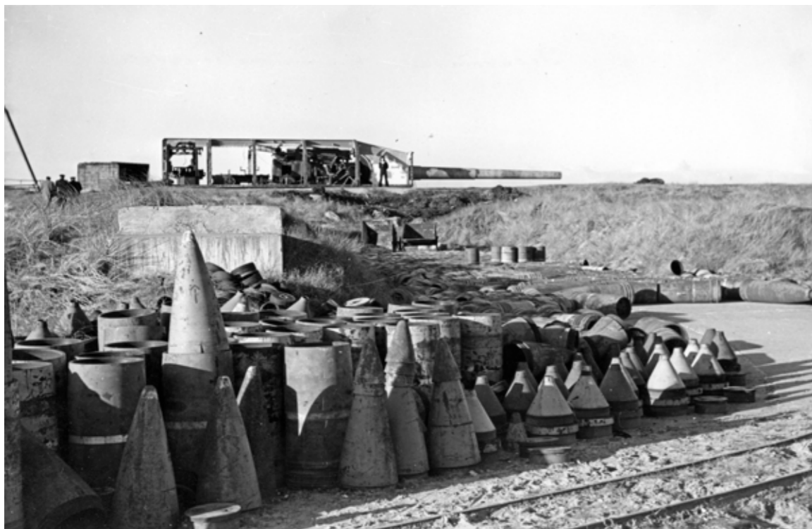
Kanontårnet på den fremtidige museumsbunker under afmontering i efteråret 1951.