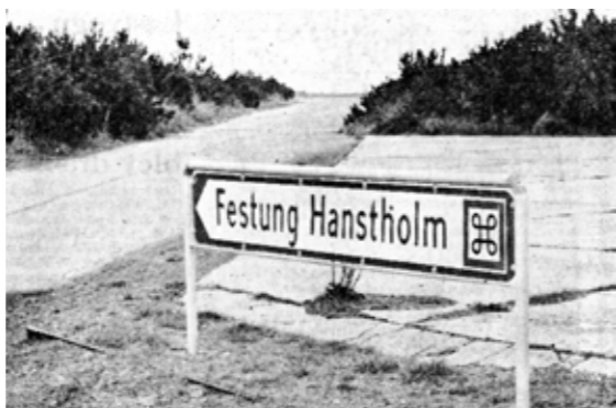
Vejskiltet, som skabte så megen postyr, ved indkørslen til museumsbunkeren. Jyllands-Posten 6.10.1979.