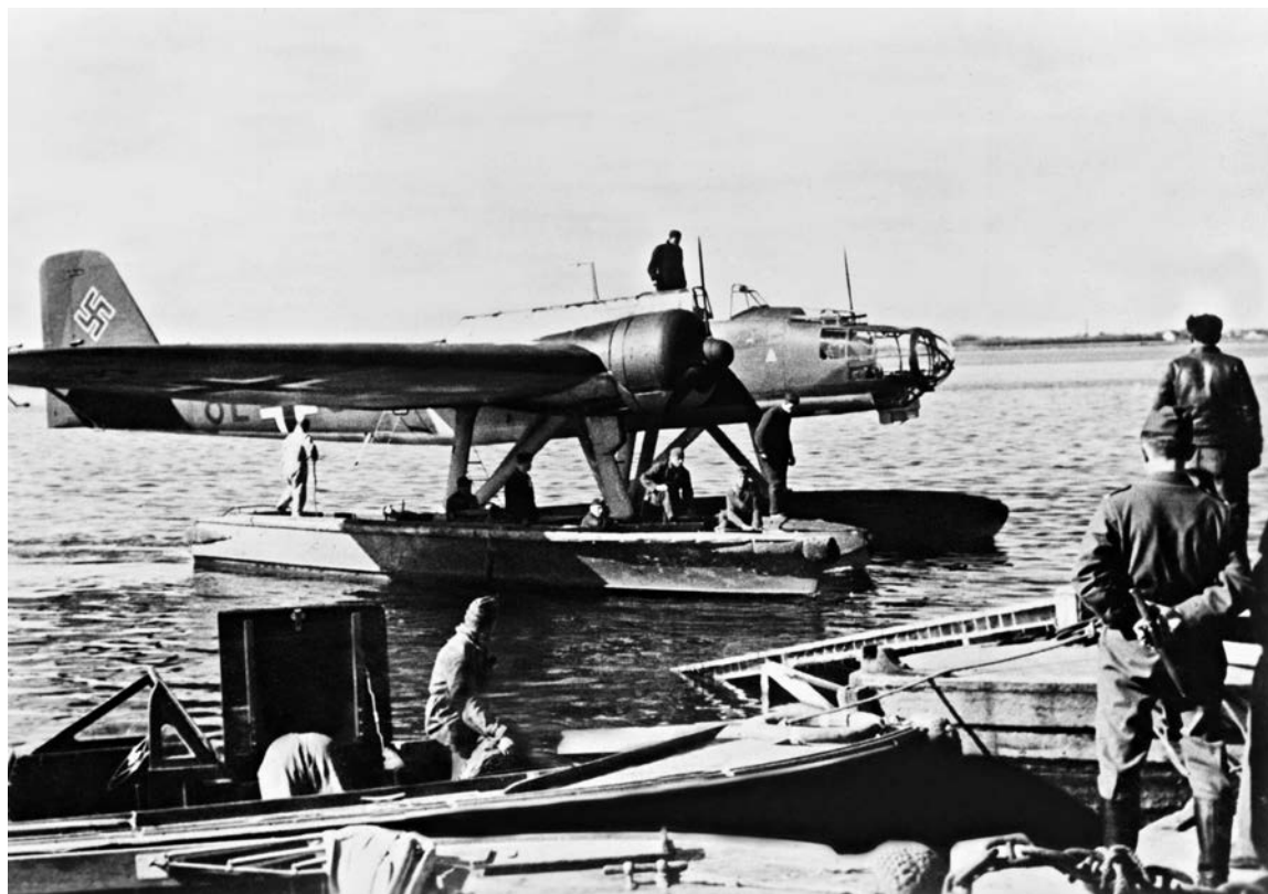
Et tysk søfly af typen Heinkel He 115 fra 1./Küsten-Flieger-Gruppe 906, fotograferet i på Limfjorden ved søflyvepladsen ved Aalborg i april-maj 1940.

Midt på eftermiddagen 7. maj 1940 indløb der en alarm fra Hanstholm til Führer der See-Luftstreitkräfte Ost , som sad i Kiel og styrede indsatsen af søflystyrkerne i Østersøområdet – hans ansvarsområde gik helt op til Hanstholm. Alarmen lød på, at man havde observeret en kraftig tåge foran kysten vestnordvest for Hanstholm, og at man mente, at den var kunstig.